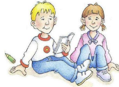
Delo v paru