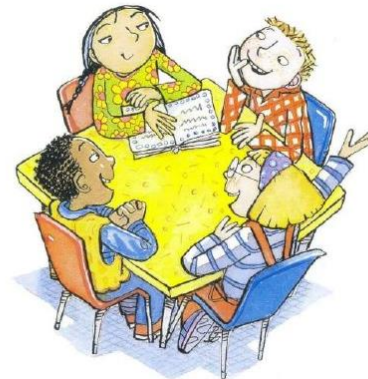
Delo v skupini